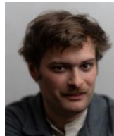
GROSSO MODO Créateur de contenus et « poète urbain », Grosso Modo raconte ses balades poétiques parisiennes sur les réseaux sociaux via son compte « Les balades Grosso Modo ».